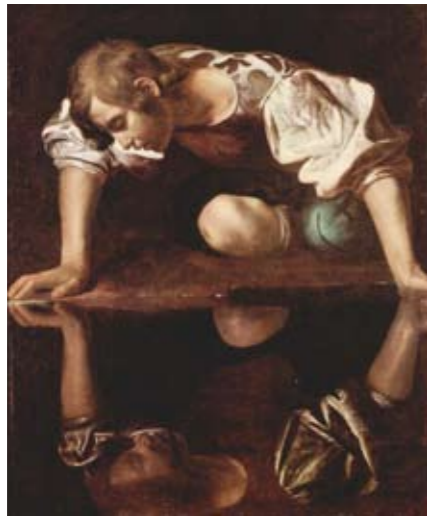
Narciso 112 x 92 cm Roma - Galleria nazionale d'Arte Antica, Palazzo Barberini.

Allestire una mostra impossibile è facile: infatti, la Rai dispone di 20.000 riproduzioni in alta definizione dei capolavori d'arte conservati nei principali musei di tutte le regioni d'Italia.