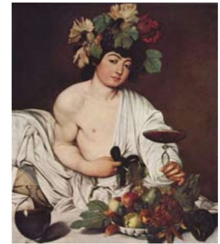
A destra, Bacco 98 x 86 cm Firenze - Galleria degli Uffizi.