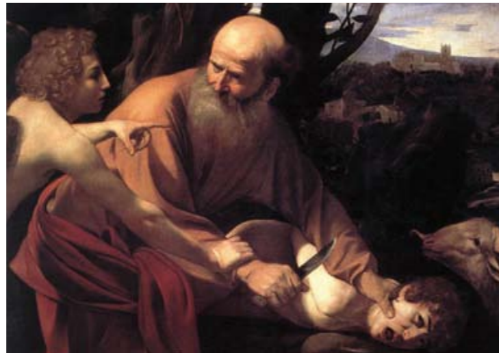
Sacrificio di Isacco 104 x 135 cm Firenze - Galleria degli Uffizi.