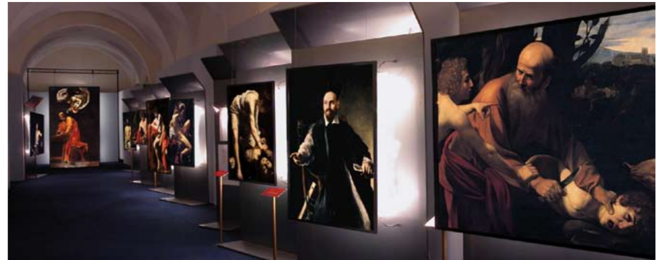
Particolare della "mostra impossibile" di CARAVAGGIO A SALERNO, nell'allestimento dell'ex Convento di Santa Sofia (14 giugno - 20 luglio 2003).