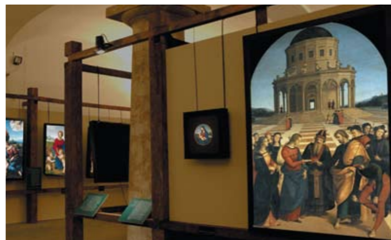
A destra e nella pagina a fronte, la "mostra impossibile" RAFFAELLO PER ANTOLOGIA, nell'allestimento di Napoli, al Palazzo Reale.

L'effetto delle riproduzioni di questa "mostra impossibile" è di straordinaria drammaticità. Per esempio, fa quasi rabbrivire il corpo del San Giovanni caduto a terra, mentre dal collo sgorga il sangue nel cui rosso il Caravaggio ha apposto la propria firma: un particolare che si può quasi toccare con mano nella riproduzione, mentre nell'originale non sarebbe possibile avvicinarsi tanto.