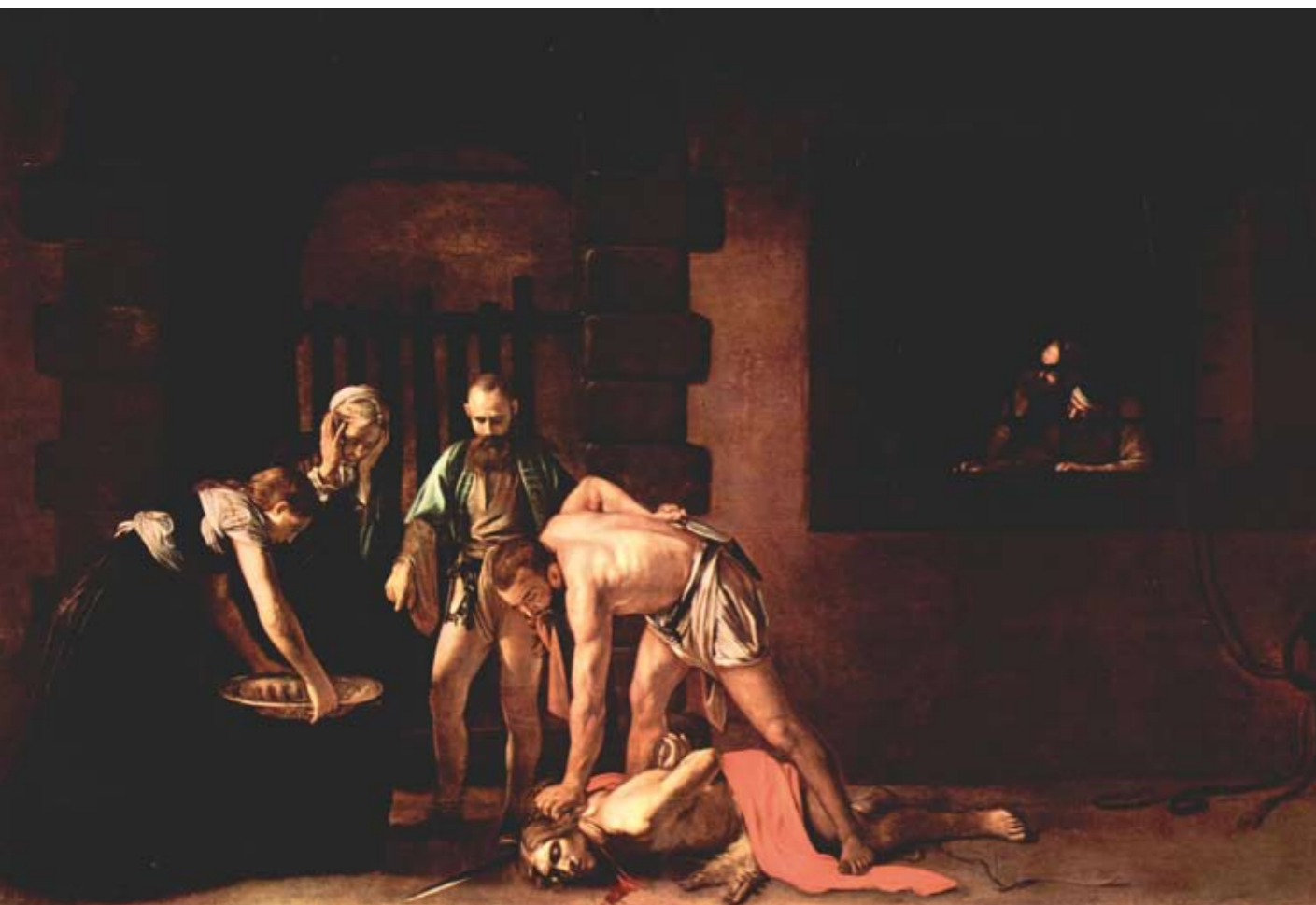
Decollazione del Battista 361 x 520 cm La Valletta - Malta Co-cattedrale di San Giovanni.