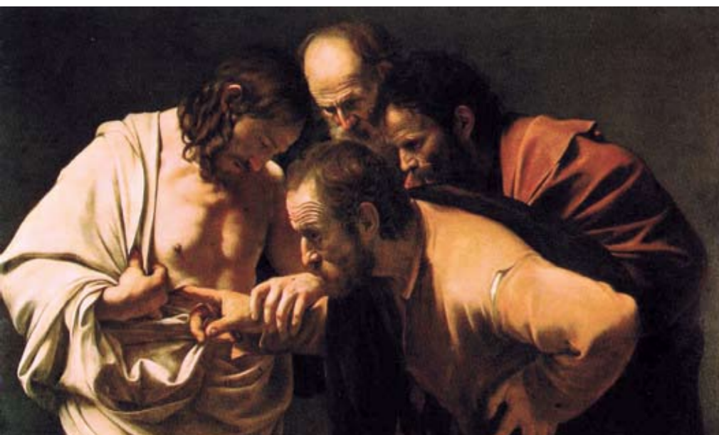
Incredulità di San Tommaso 112 x 150 cm Postdam - Sansouci Staatliche Schlösser und Gärten, Bildergalerie.