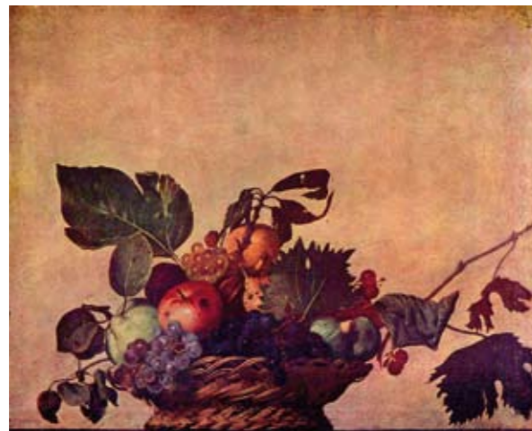
Sopra, particolare della “mostra impossibile” TUTTA L’OPERA DEL CARAVAGGIO, nell’allestimento di Napoli, a Castel Sant’Elmo.