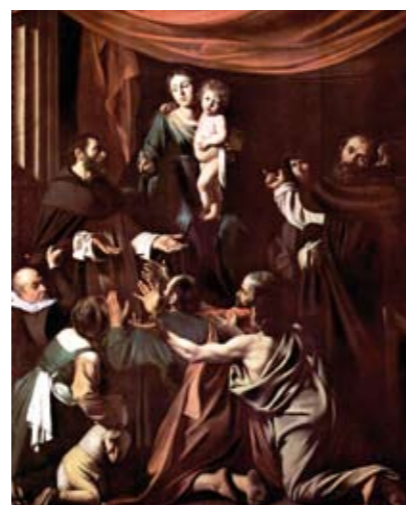
A destra, La Madonna del Rosario 364,5 x 249,5 cm Vienna - Kunsthistorisches Museum, Gemäldegalerie.

Per la gestione dei supporti fisici delle riproduzioni e delle informazioni pertinenti è stato progettato un data base interrogabile in base ai campi di registrazione delle informazioni (autore, genere, città, tema ecc.) o anche in base a un sistema di chiavi multiple scelte fra un numerosissimo repertorio di caratterizzazione dell'opera d'arte. Questo “indice analitico dei concetti e dei nomi”, esteso e ragionato, costituisce un elemento qualificante del sistema di ricerca predisposto dalla Rai.