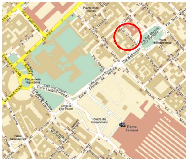
APAT, Sala Auditorium Via Curtatone, 7- 00185 Roma